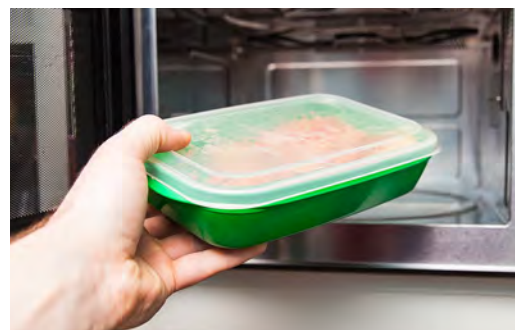
如果食品解冻后立即烹饪或供应, 可以微波炉解冻