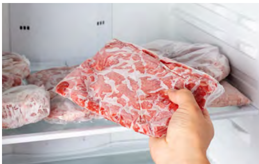
冷藏室内 41° F (5° C) 以下解冻 这是最安全的方式