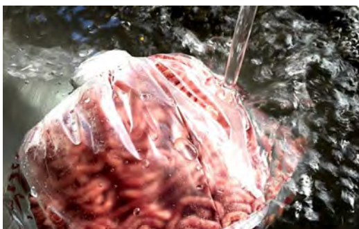
的流水解冻 浸入水中, <70°F (21°C)